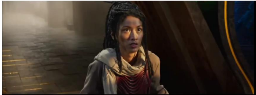
Gambar 1. Cuplikan Iklan Marjan

Gambar 1. Pada iklan ini terdapat tokoh seorang anak perempuan anak dari Mpu Baradah, ia mengenakan pakaian dengan nuansa tradisional dengan perpaduan warna merah tua, putih, dan abu-abu. Gaya pakaian yang tidak berlebihan ini menunjukkan nilai kesederhanaan ditengah kecanggihan teknologi. Model rambut yang panjang dan di kepang kebelakang menunjukan bahwa ia tidak ingin rambutnya yang panjang mengganggu aktivitasnya dan agar tidak merasa kepanasan. Dalam banyak budaya, rambut panjang yang diikat melambangkan kekuatan dan keteguhan. Misalnya, dalam cerita rakyat Banten, rambut panjang tokoh perempuan dianggap sebagai sumber kelemahan dan kekuatan. Selain itu, (Seha. N 2023) dalam budaya Jawa, rambut panjang yang diikat atau digelung, seperti pada sanggul ukel konde, menunjukkan kewibawaan dan status sosial seseorang. Selain itu, ekspresi yang dimunculkan adalah ekspresi waspada. Gesture anak perempuan tersebut menunjukkan bahwa dia seseorang yang memiliki insting yang bagus dan cekatan untuk memantau ancaman bahaya yang akan datang.